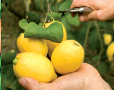
Limones BIO de Sicilia