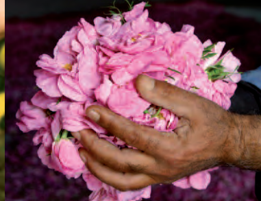
Rosas BIO de Turquía