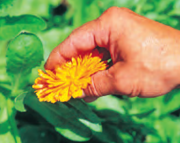
Caléndula BIO de Alemania